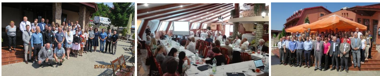
Zemplínska šírava ... foto účastníkov konferencií 2022, 2018, 2015