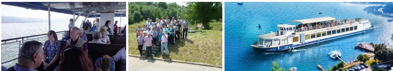
..nová výletná loď