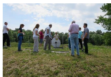
Zemplínska širava 2015 a 2018 ... foto účastníkov konferencií